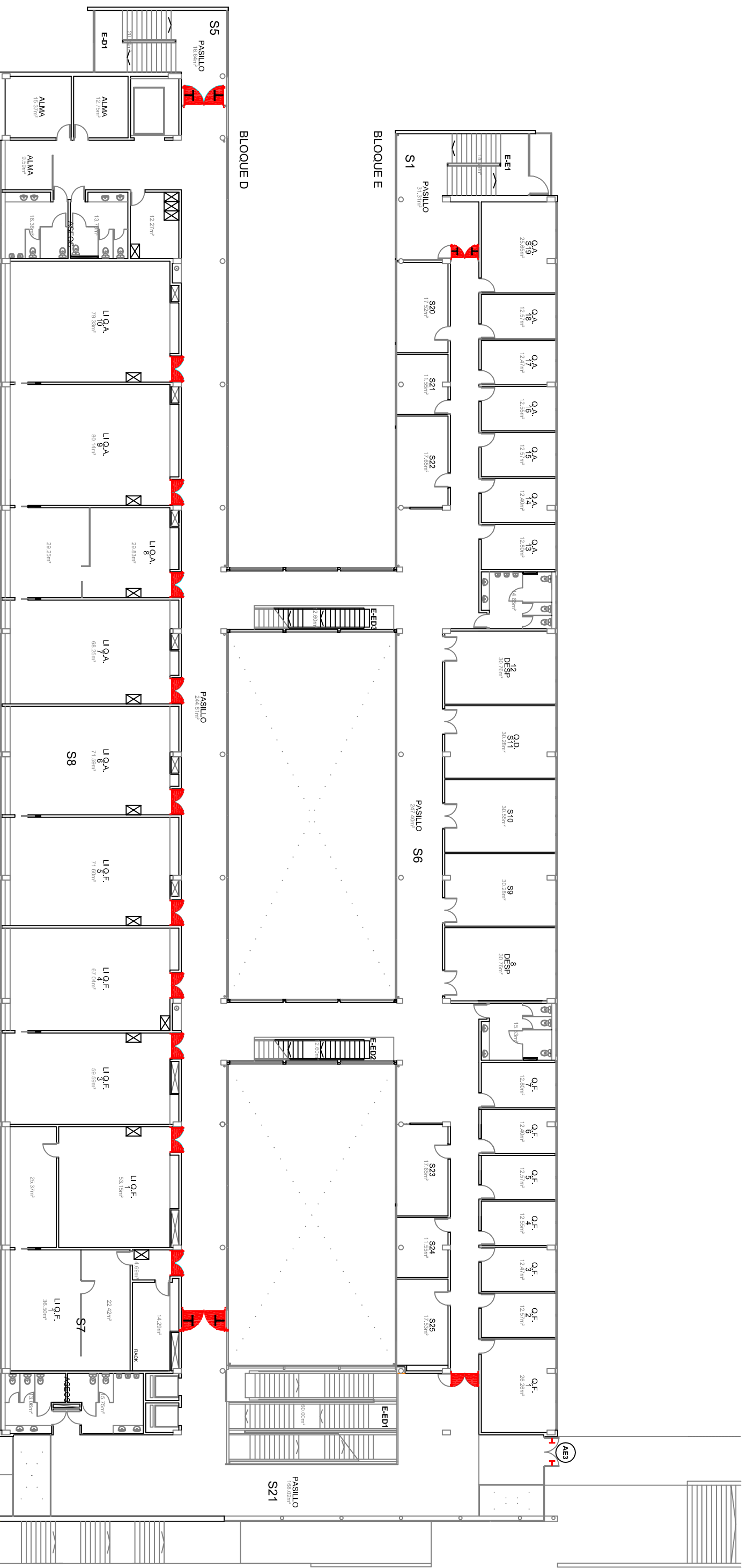
PLANTA SEGUNDA BLOQUES D Y E 22718,43m 2